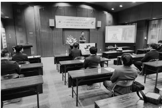
6月例会 R8関東ブロック大会 in ひたちむけ