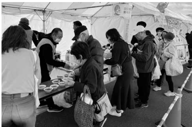
第46回日立市産業祭 芋煮無料配布