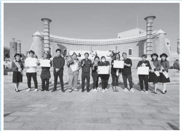
第9回常陸ノ国グルメフェス(令和6年3月31)