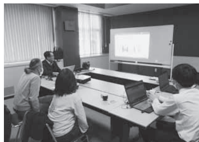
(昨年の相談会の様子)