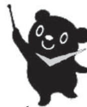
最低賃金制度のマスコット チェックマン

*年齢やパート・学生・アルバイトの働き方の違いにかかわらずすべての労働者に適用されます。