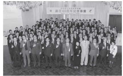
青年部 創立40周年記念事業