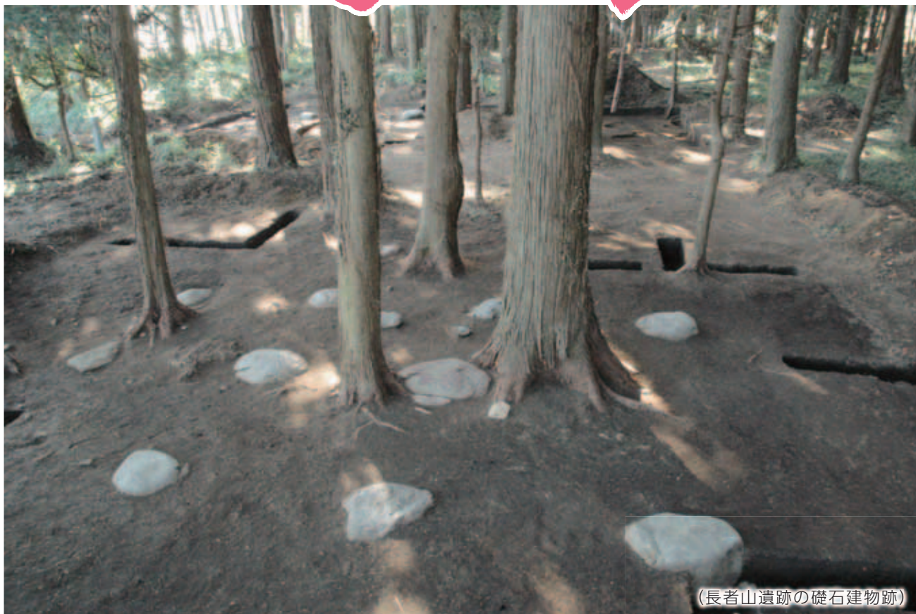
(長者山遺跡の礎石建物跡)