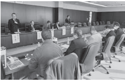
観光環衛業部会 先進地事例研修会