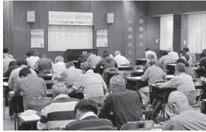
新ふるさと日立検定試験