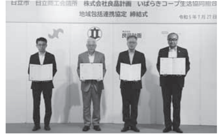
日立市・株式会社良品計画・いばらきコープ生活協同組合との地域包括連携協定締結