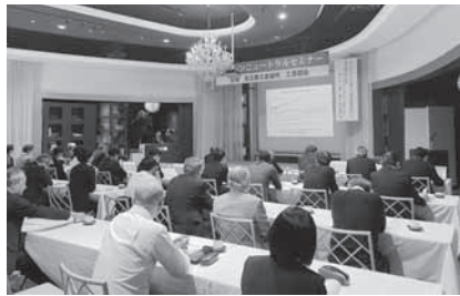
工業部会 カーボンニュートラルセミナー