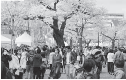
第59回 日立さくらまつり 花見茶屋・土産品販売店・ボランティアガイド