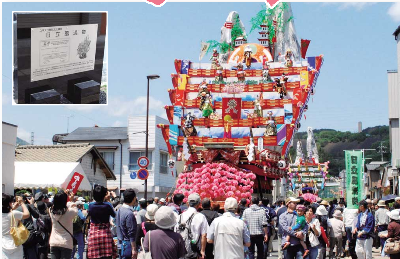
7年ぶりに4台同時公開された日立風流物(5月3日~5日に開催された神峰神社大祭にて) 写真切抜き(左上)は日立風流物が2009年にユネスコ無形文化遺産に登録されたのを記念して、今年3月に宮田町の通称おまつりロードに設置された記念碑