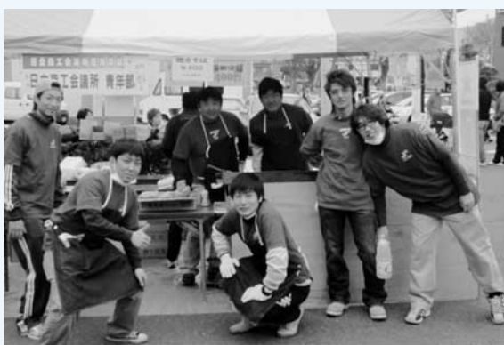
今年の日立さくらまつりにて