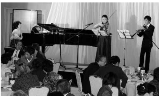
交流会の最後を飾ったトロワ・シャンテ

としてその卓越した洞察力と指導力をこれからも遺憾なく発揮され、事業所をはじめ業界そして当市発展の大きな原動力としてご活躍されることをご期待しております。」と述べ受賞者を称えました。