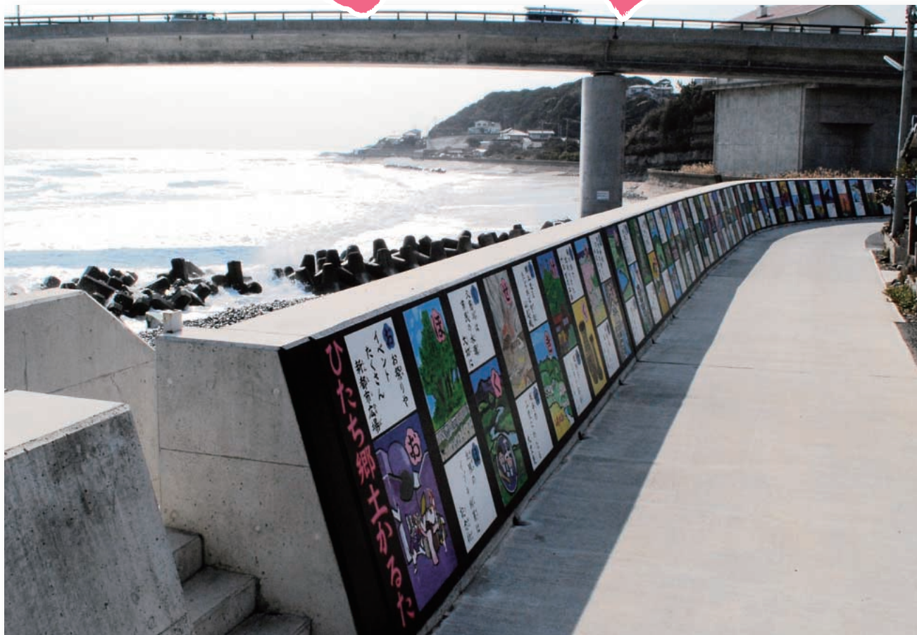
東日本大震災の津波から沿岸の住民を守った堤防に描かれた「ひたち郷土かるた」：旭町商店会主催