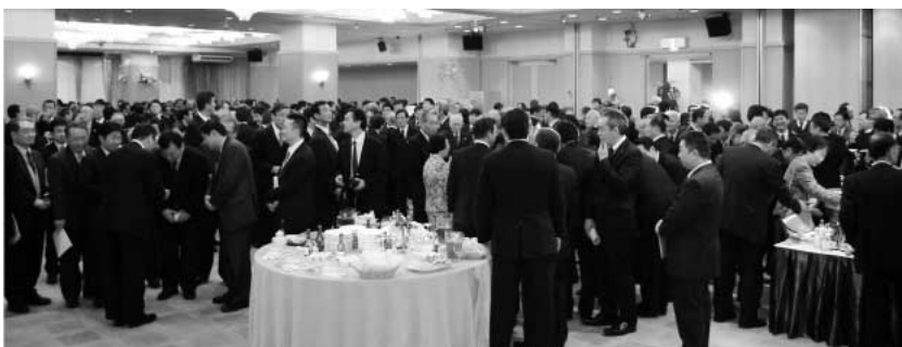
超満員の会場内では随所で新年の挨拶を交わす姿が見られた