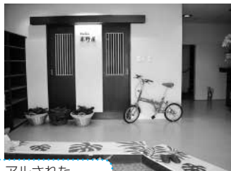
リニューアルされた(写真上) エントランス (写真下) フロント