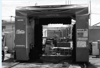
洗車機を新しく入れ替えました!! 車にやさしいスポンジブラシ洗車機です。