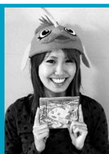
口福あんこう イメージキャラ アツちゃん

〒316-0024 茨城県日立市水木町1-1-15 TEL.0294-52-2522 FAX.0294-52-2507 URL http://www.hagi-ya.com