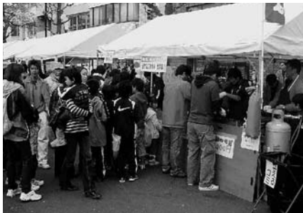
4月例会(4月3日、4日) さくらまつりに出店 (焼きそば・駄菓子等の販売)