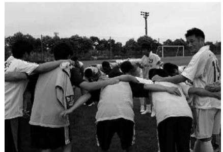
7月例会(7月3日、4日) 商工会議所青年部第8回全国サッカー大会福島大会に参加。全国から32チームがJビレッジを中心に熱戦を繰り広げた。