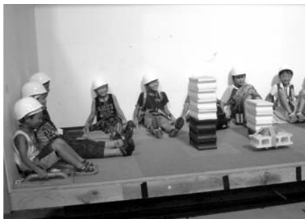
超高層でのゆれを体験する団員達

また、七月三十一日には建築デザイン探検少年団と合同で、筑波宇宙センターと(独)建築研究所を見学、宇宙への夢のある職業に触れた他、火災発生の実験や建物の地震振動実験など貴重な体験をしました。八月十一日には、科学探検少年団と一緒に、日立エンジニアリングアンドサービス大沼工場と中里水力発電所を見学、我々の生活に身近な電気を起こす機械の製造現場や仕組みを学習しました。 今後も、各団とも月一度ぐらいのペースで活動し、来年二月には修了式を迎える予定です。