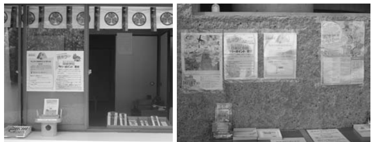
ラリー場所(御岩神社：写真左、日鉦記念館：写真右)に設置されたポスター等