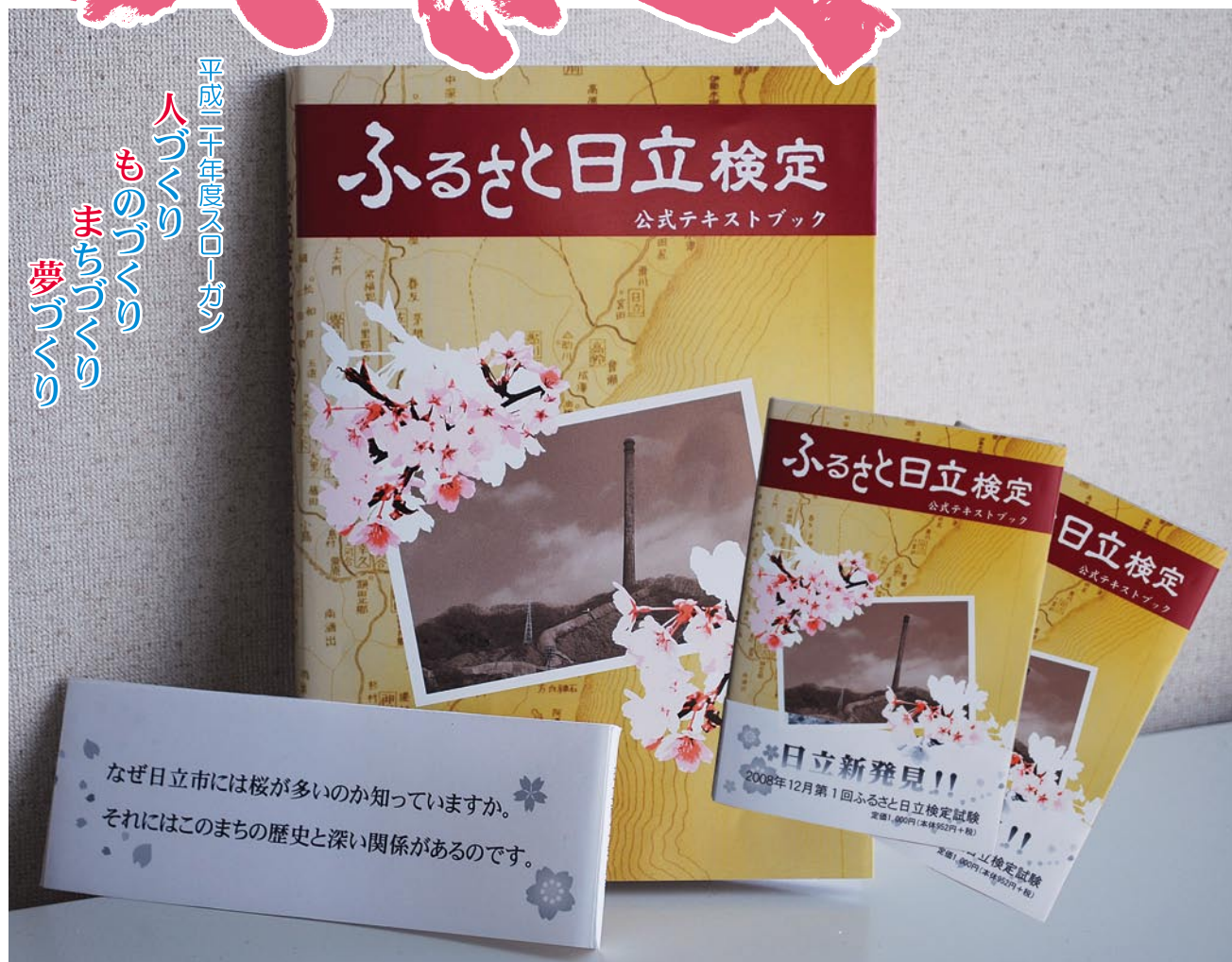
「ふるさと日立検定」公式テキストブックが完成