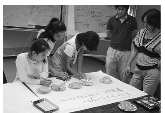
試作品を基に研究するあきんど探検少年団

「ひたちあきんど探検少年団」では、「ひたち限定ハンバーガーを作ってみよう」をテーマに、日立の特産品を使った限定品を考え、価格設定から宣伝方法・販売方法やカロリー計算まで消費者を意識し 研究をすすめています。八月九日には、スイーツ系のハンバーガーの試作品として、「夏BOXトロピカルフルーツバーガー」を作成し、団員で試食会を実施しました。旬の果物を使った小学生ならではの夢のあるハンバーガーで、自分達で作ったオリジナルバーガーをおいしそうに食べていました。八月二十九日には、ここまで研究してきた「ひたち限定バーガー」について報告書をまとめ、全五回の活動を終える事が出来ました。参加した団員からは「研究したバーガーを是非作ってほしい」との声が聞かれ、今後この報告書は地域資源活用事例として、当所で有効に活用することになっています。