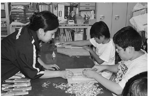
箸製作に取り組むものづくり探検少年団

ヴァイ)で銅板を叩いて銅細工を体験。また八月二十六日には未広町のコトコト工房で木工細工を体験しました。参加した団員達は暑さにも負けずに作業に取り組み、制限時間間際まで作業を行い、なんとか完成にこぎつけることが出来ました。見本のようにきれいな仕上がりませんでした。完成した自分の作品を眺め、全員満足そうにしています。